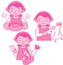
洗濯・調理・買物