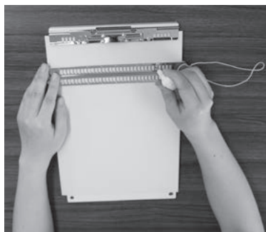
点字器は、社会福祉協議会が用意します。

にて直接または電話、もしくはWEBで受け付けます。WEBは左記のQRコードから申し込みができます。