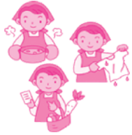
洗濯・調理・買物